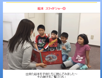
出来た絵本を子供たちに読んでみました～ その様子をご覧ください。